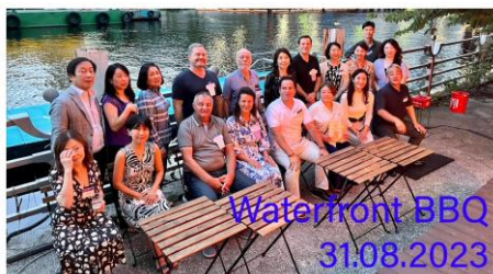
Waterfront BBQ 31.08.2023