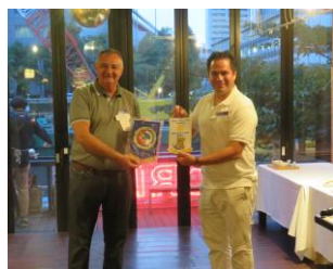
↑ Banner exchange with Serbia & Montenegro RC