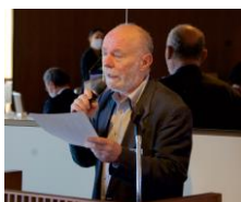
Mt. Takao members→