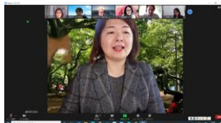
← World Speech Day