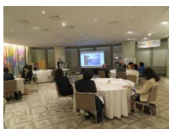
↑ Ms. .Hochi, the speaker of the day