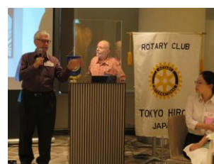
↓ HAPPY BIRTHDAY !!