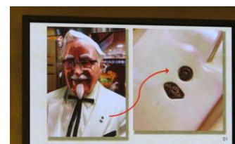
↑ Kernel Sanders was a ROTARIAN!!