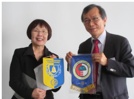
↑ Banner exchange with RC of Saint Girons, Couserans, FRANCE