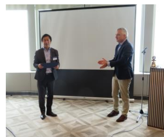
↑ Shimada san has received Yoneyama Award